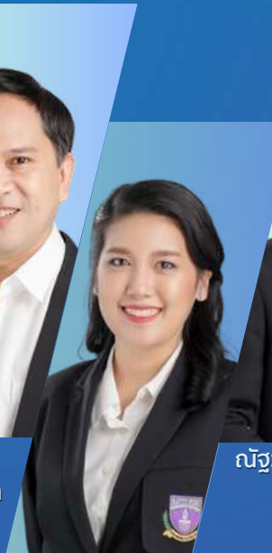
จิตติพันธ์ ความนิง